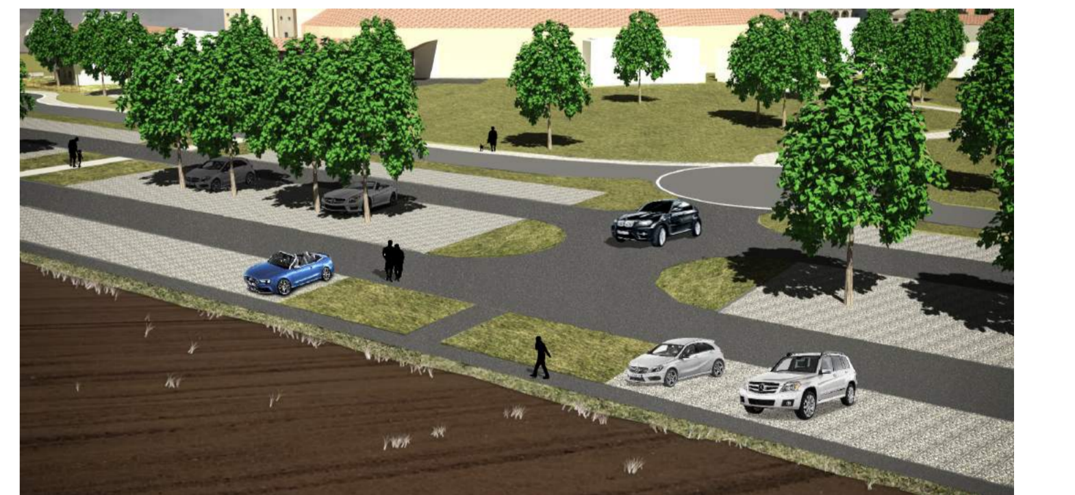
Vista dell'accesso al parcheggio sud dalla viabilità di distribuzione