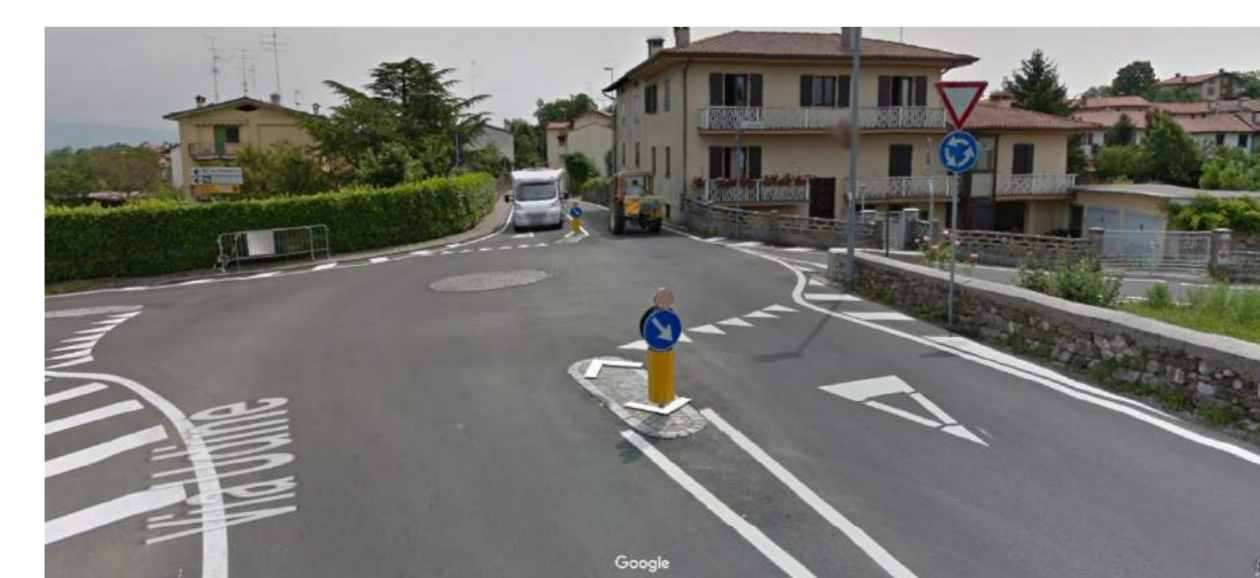
Esempio di rotonda urbana sormontabile