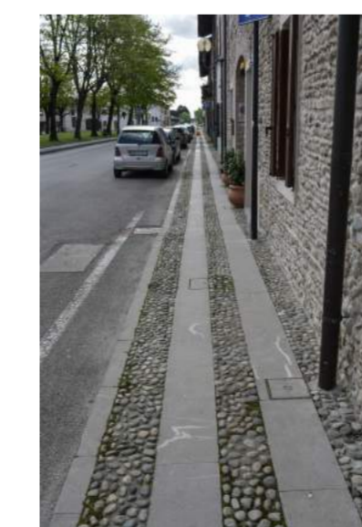
Esempio di percorso pedonale