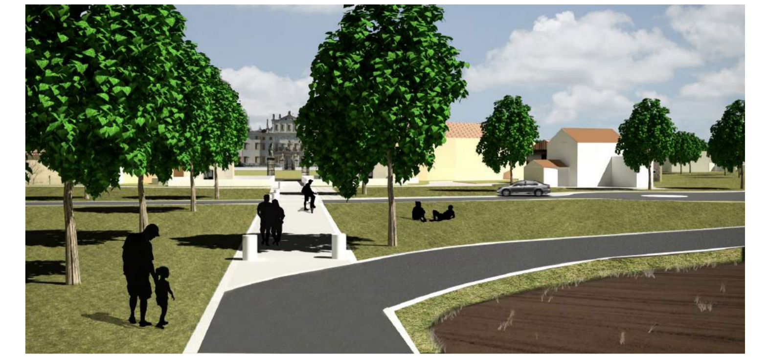
Vista del percorso di accesso alla Villa da sud e accesso al parcheggio