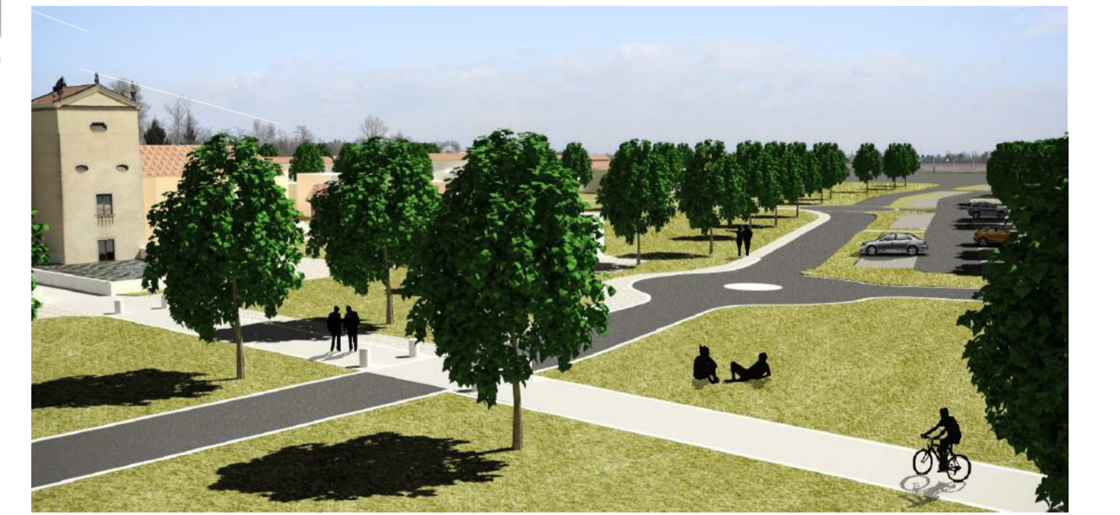
Vista del percorso di accesso alla Villa da sud e viabilità di distribuzione