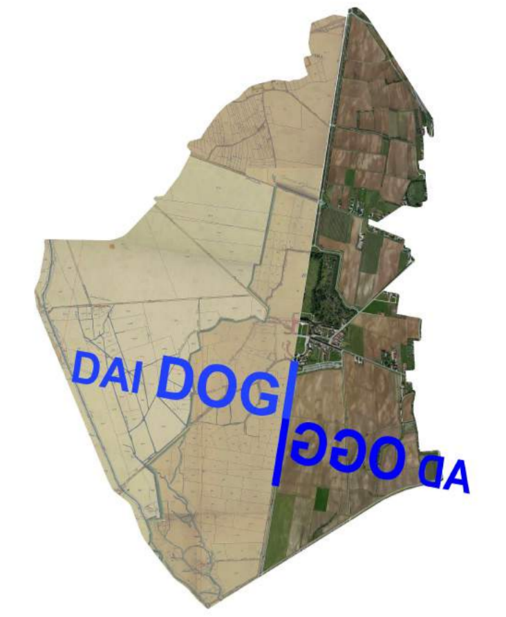
Tavola numero P.1.4 Territorio agricolo scala 1:5000 - 1:10000

Studio Associato di Architettura Anna Maria Baldo Anna Emilia Polano 33100 Udine, Via Mantica, 26 Tel. e Fax. 0432 - 504378 C.F. p.iva 01519290306 annaemilia@virgilio.it