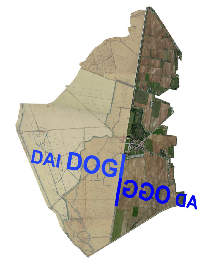
Tavola numero P.4.16 Case sparse ed attività: ambito 20 - 21 scala 1:500, 1:200