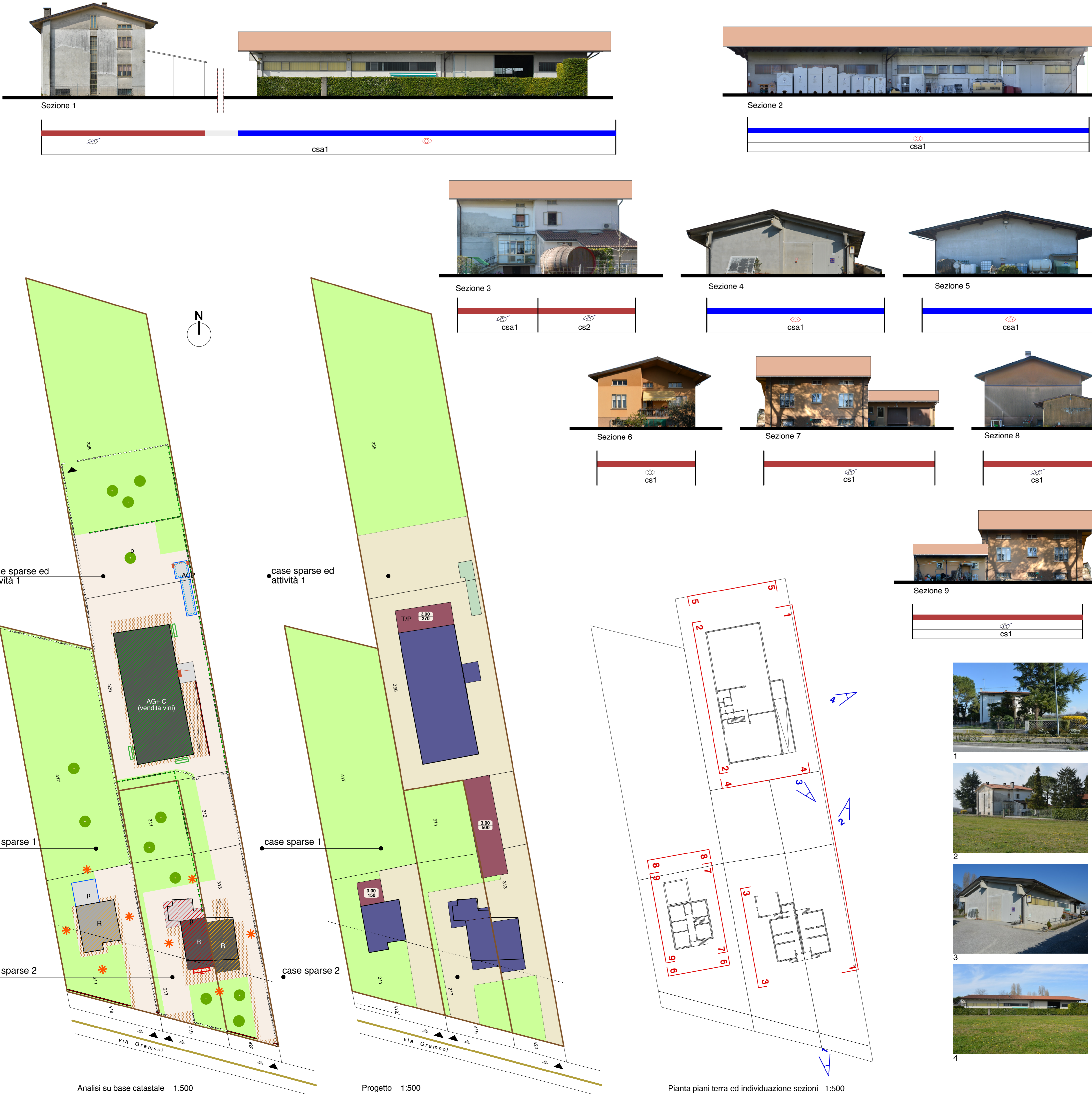
Analisi su base catastale 1:500