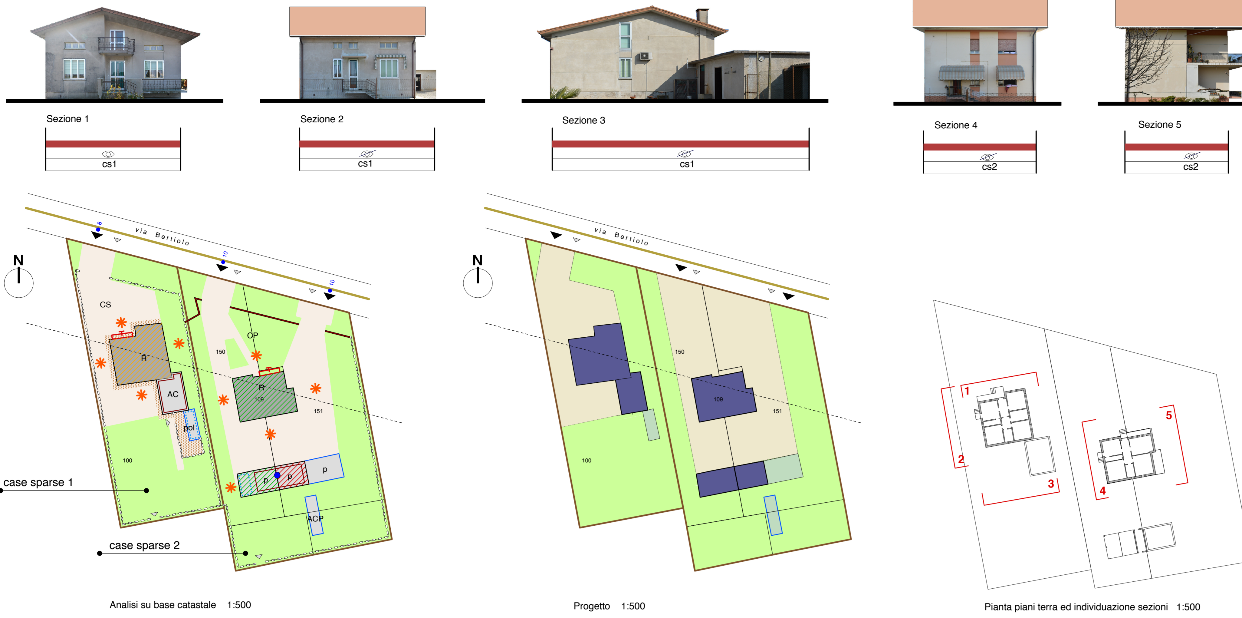
Analisi su base catastale 1:500