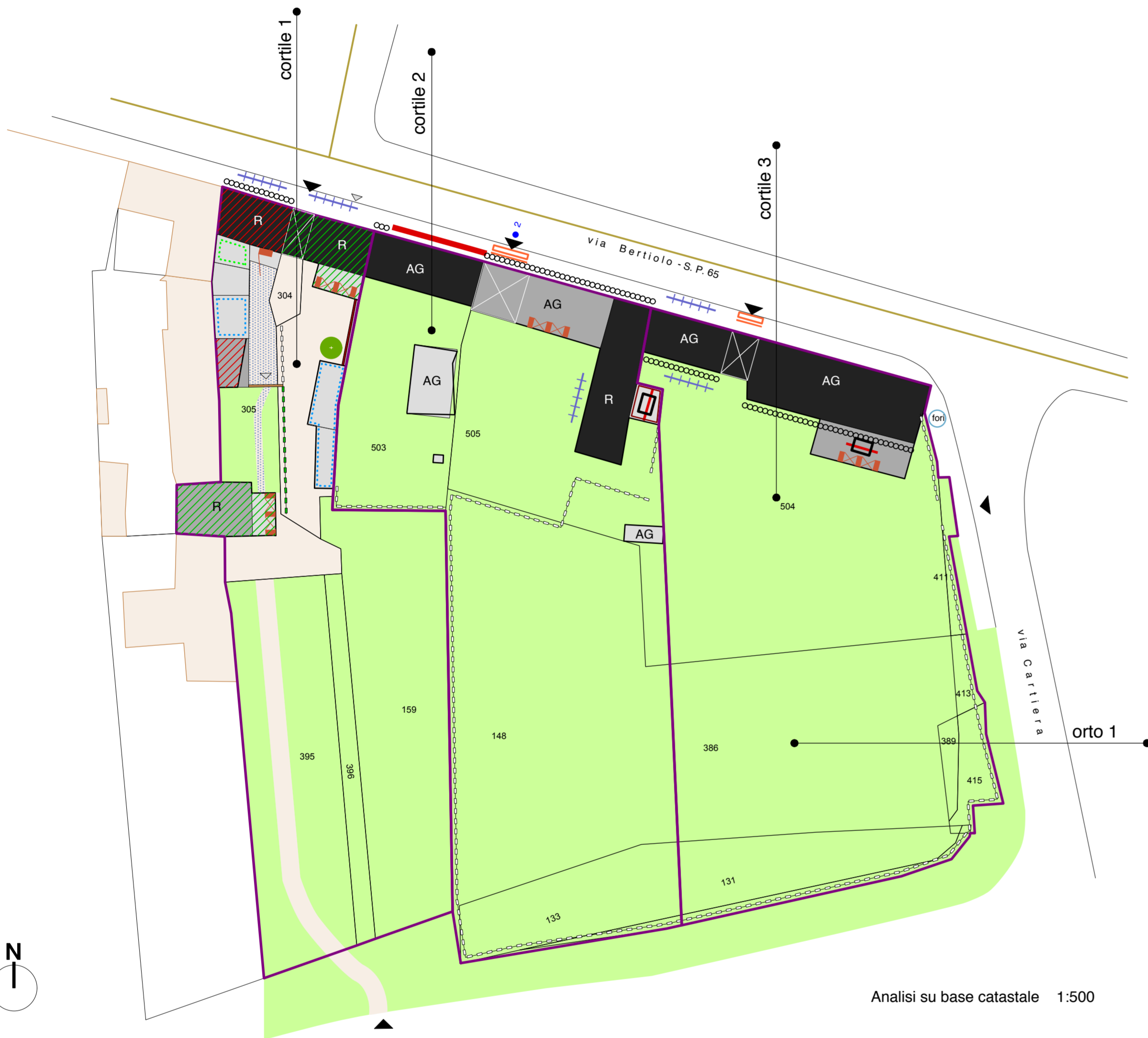
Analisi su base catastale 1:500

progetto - cortile 2: in caso di trasformazione d'uso in ricettivo complementare e pubblico esercizio è ammessa una nuova costruzione anche con strutture in ferro e vetro come da esempi. In caso di trasformazione in alberghiero, alberghiero complementare, pubblico esercizio deve essere realizzato un percorso pedonale/ciclabile che connetta il parcheggio a sud con Piazza dei Dogi.