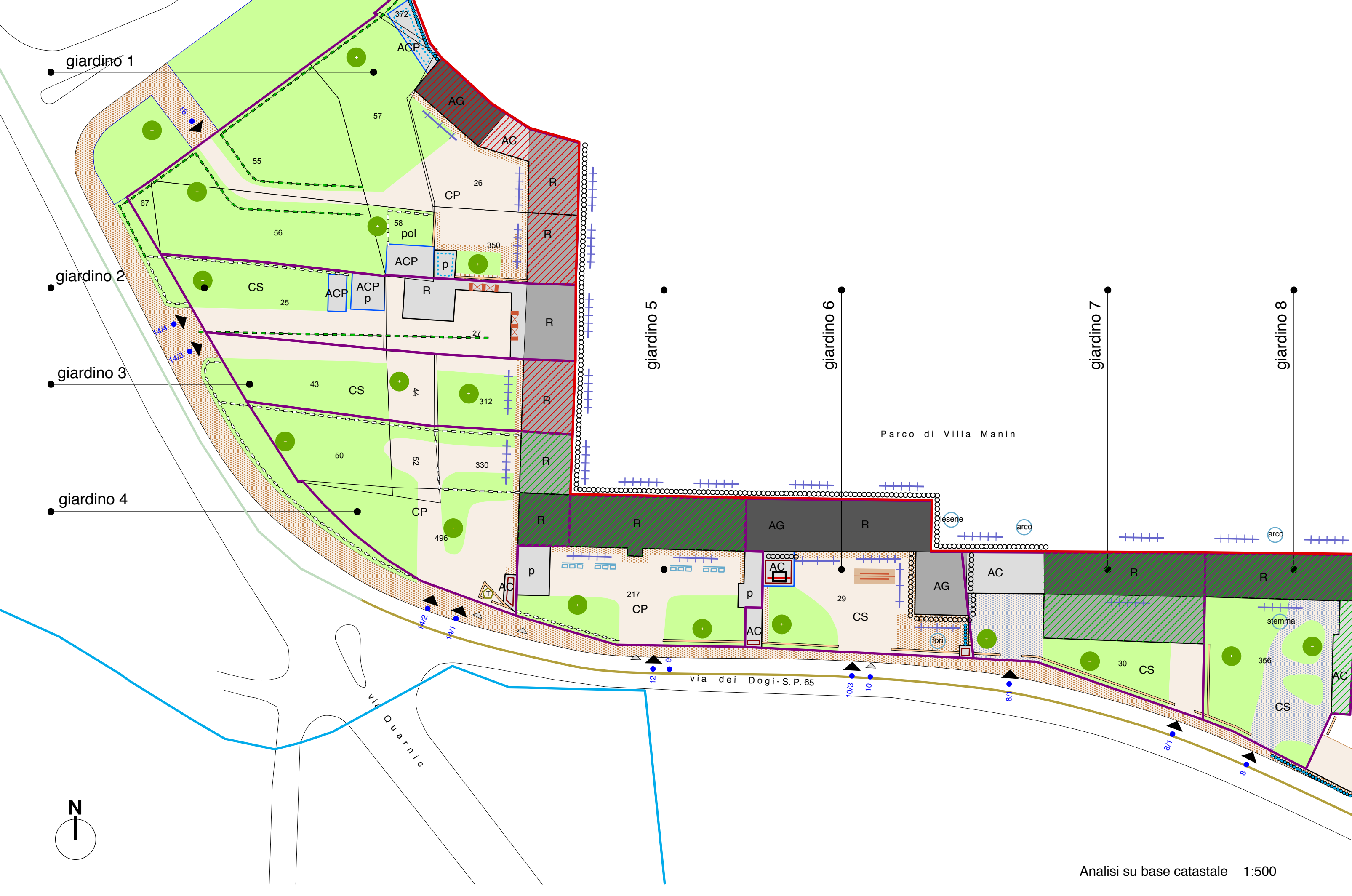
Analisi su base catastale 1:500