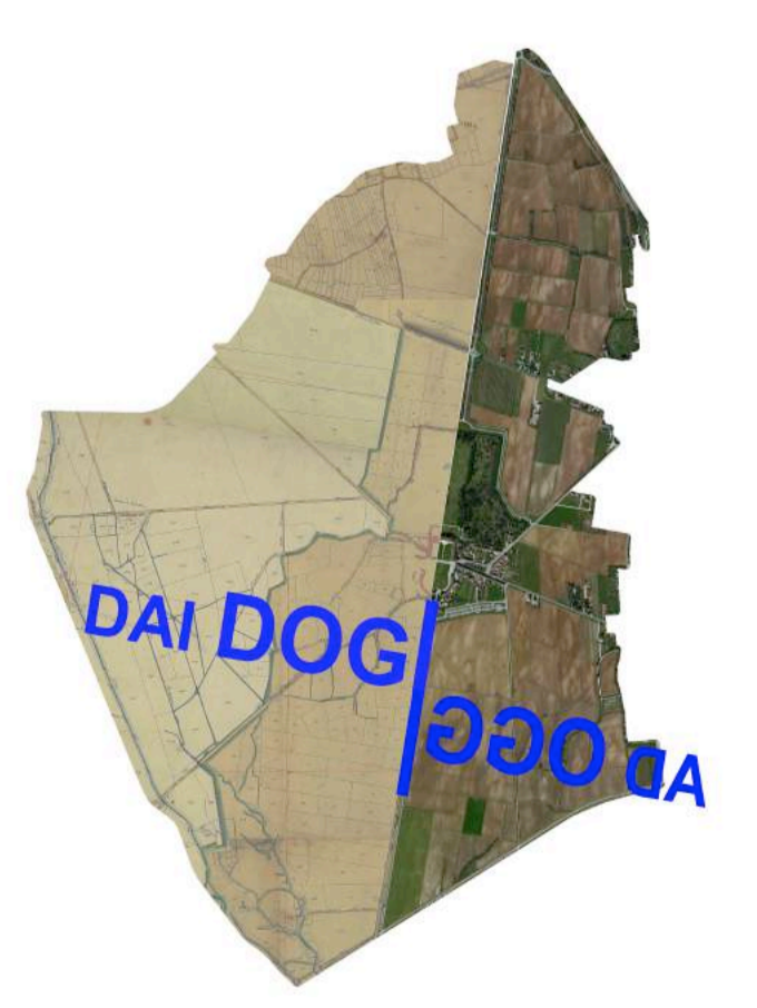
Tavola numero P.4.12 Case sparse ed attività: ambito 16 scala 1:500, 1:200

COMUNE DI CODROIPO Piano Attuativo Comunale del Centro Storico Primario di Passariano e del complesso monumentale di Villa Manin