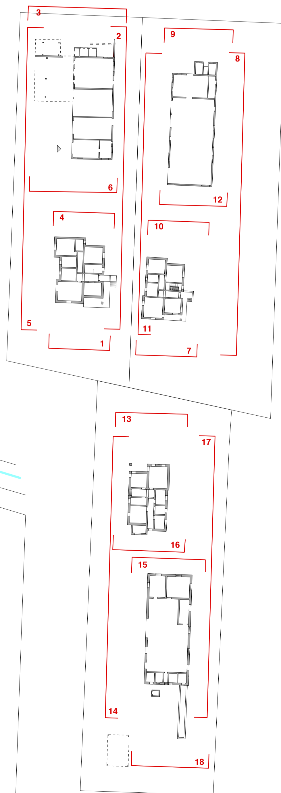
Piani terra e individuazione sezioni 1:500