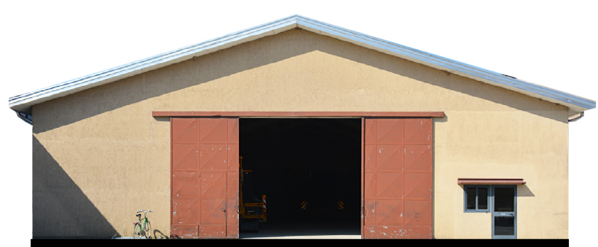
Sezione 2 1:200