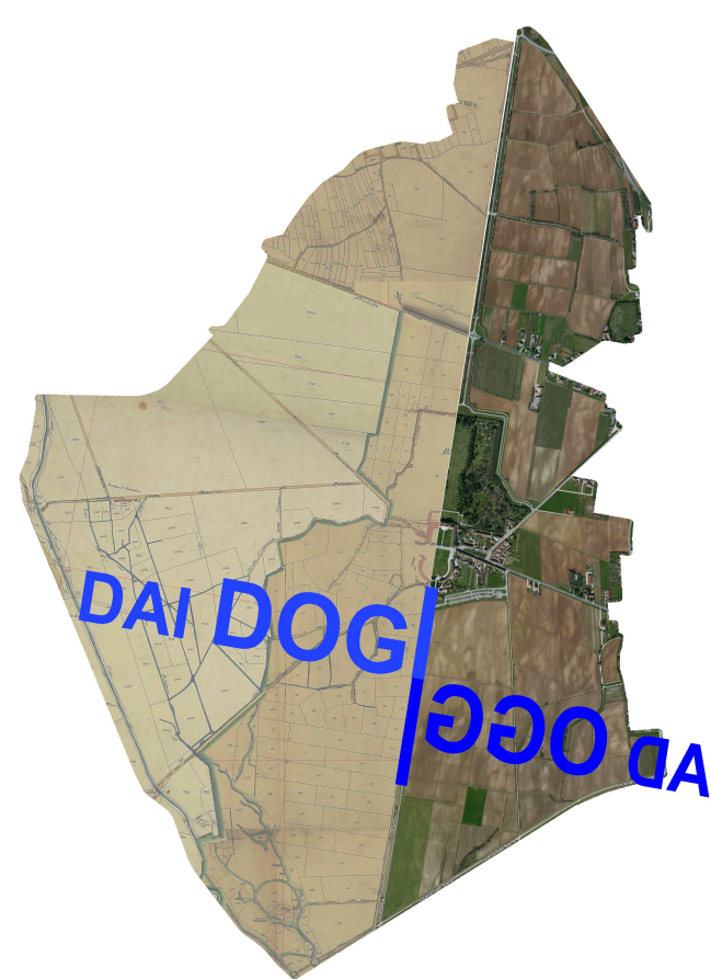
Tavola numero A.4.13 Analisi case sparse ed attività: ambito 20 scala 1:500, 1:200

COMUNE DI CODROIPO Piano Attuativo Comunale del Centro Storico Primario di Passariano e del complesso monumentale di Villa Manin