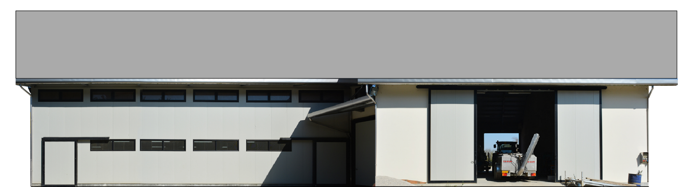
Sezione 4 1:200