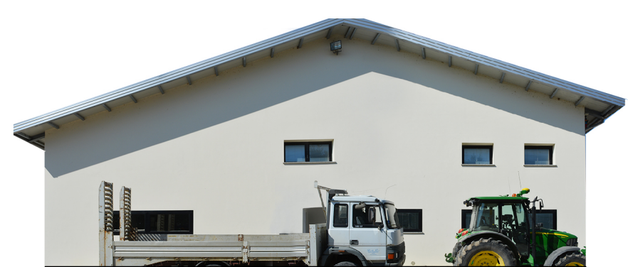
Sezione 5 1:200