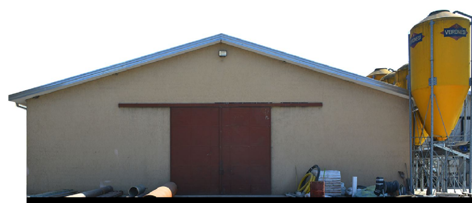
Sezione 1 1:200