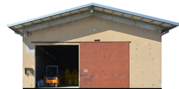
Sezione 6 1:200