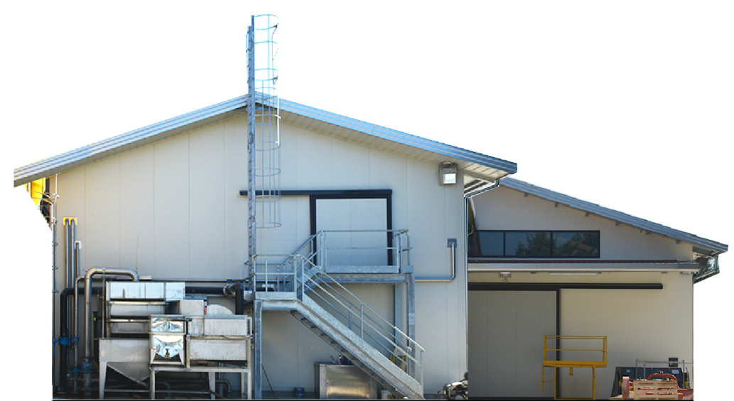
Sezione 3 1:200