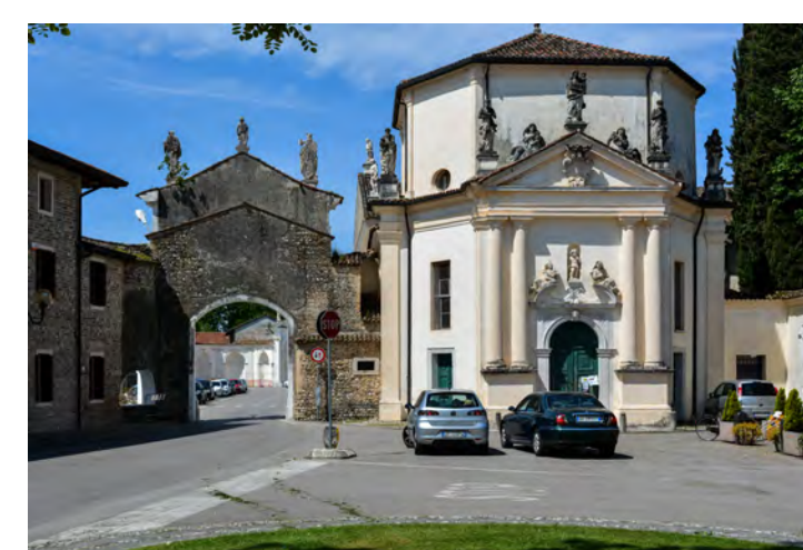
Accesso alla Villa da est - veicolare/pedonale