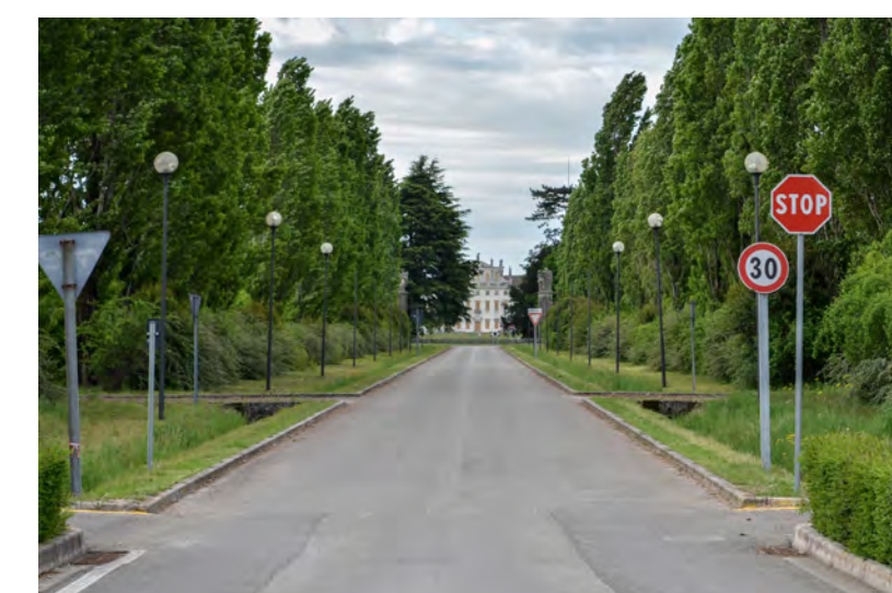
Accesso veicolare da nord