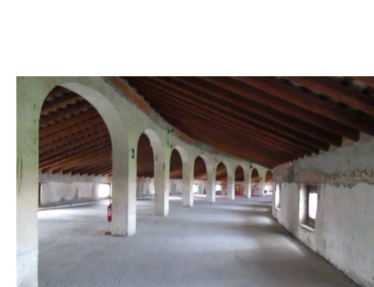
Piano secondo esedra di levante - interno