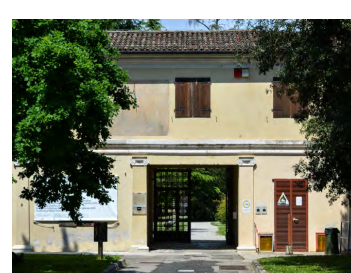
Accesso al parco attraverso la corte su via Dei Dogi