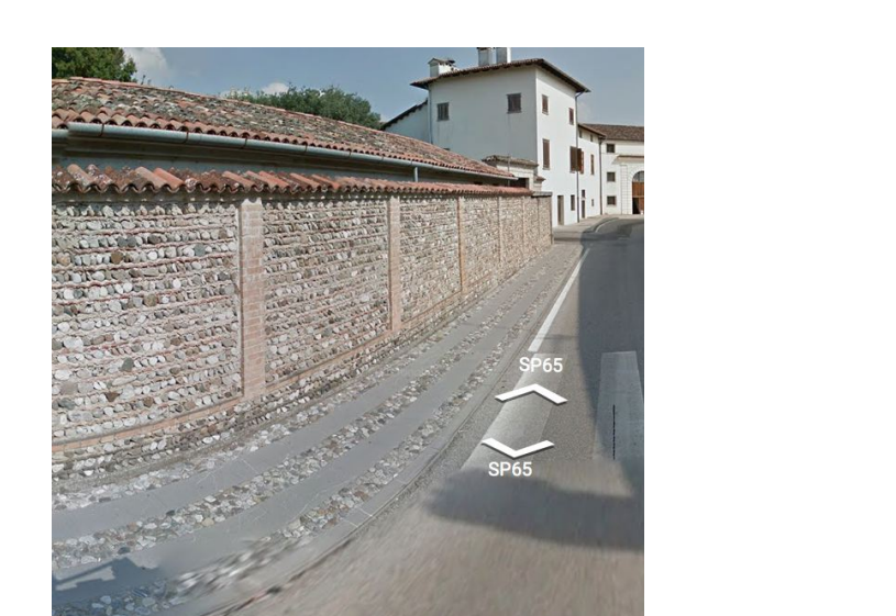
Particolare marciapiede in ciottoli misti a pietra su via Dei Dogi