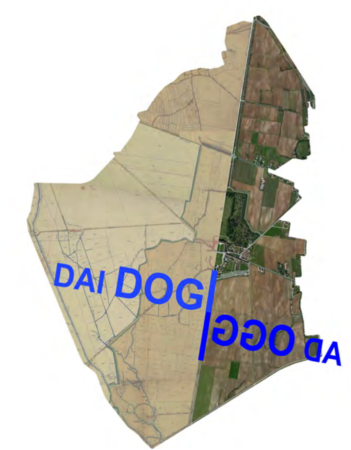
Tavola numero A.2.1 Villa Manin e Parco Analisi delle funzioni