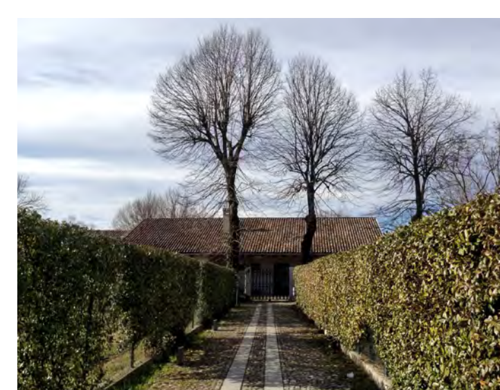
Accesso pedonale dal parcheggio ovest