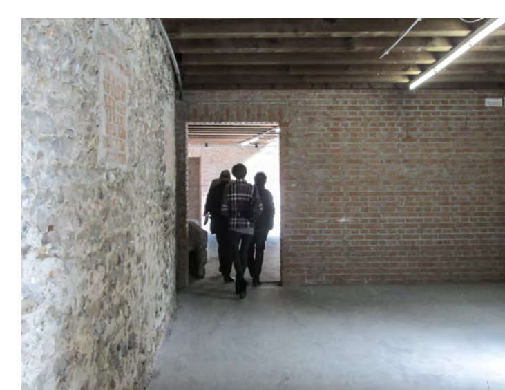
Piano primo esedra di levante - interno