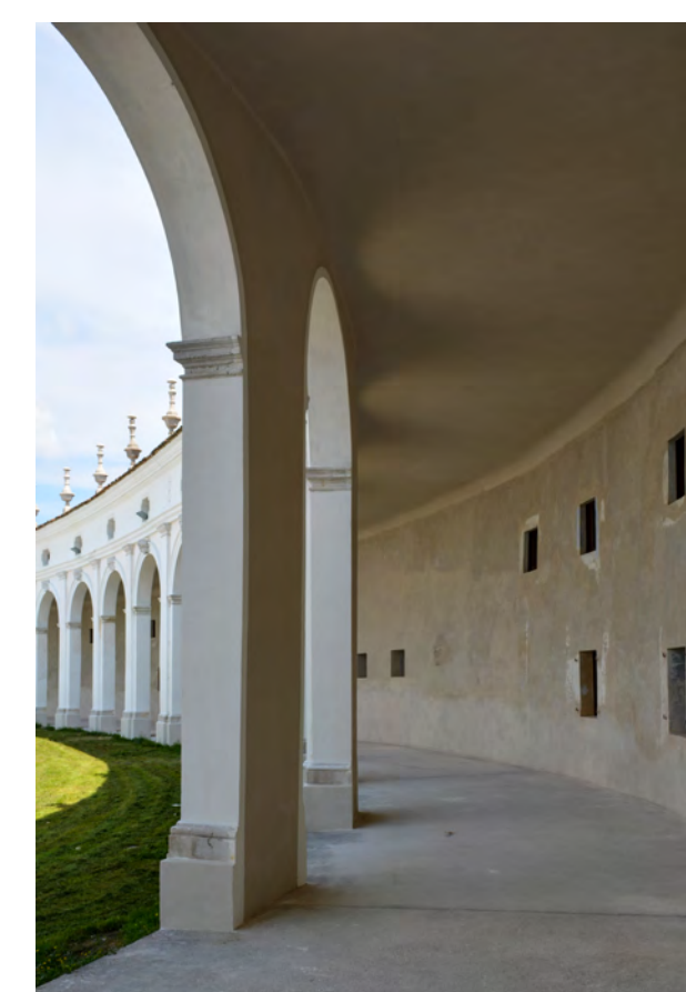
Piano terra esedra di ponente - porticato pedonale