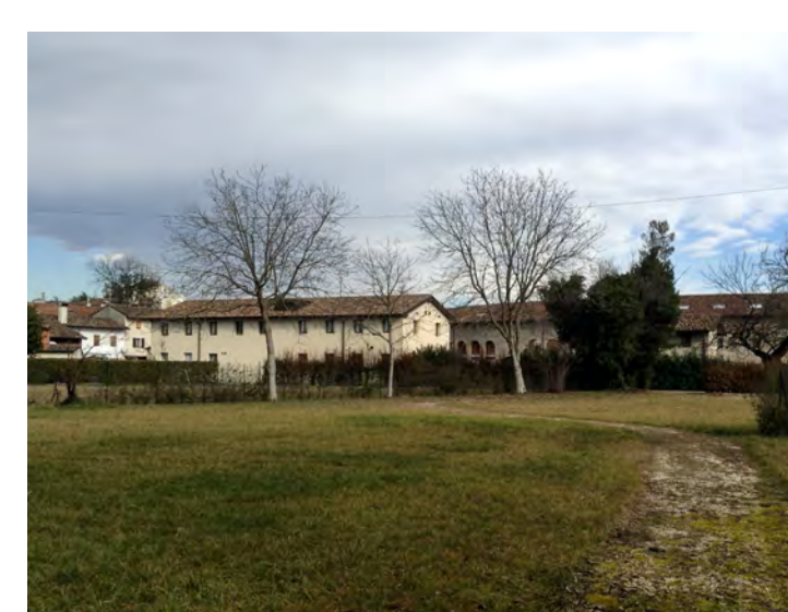
Accesso pedonale dal parcheggio ovest