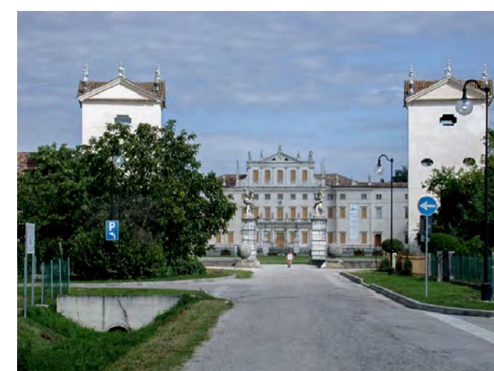
Accesso da sud - pedonale alla Villa, veicolare ai parcheggi