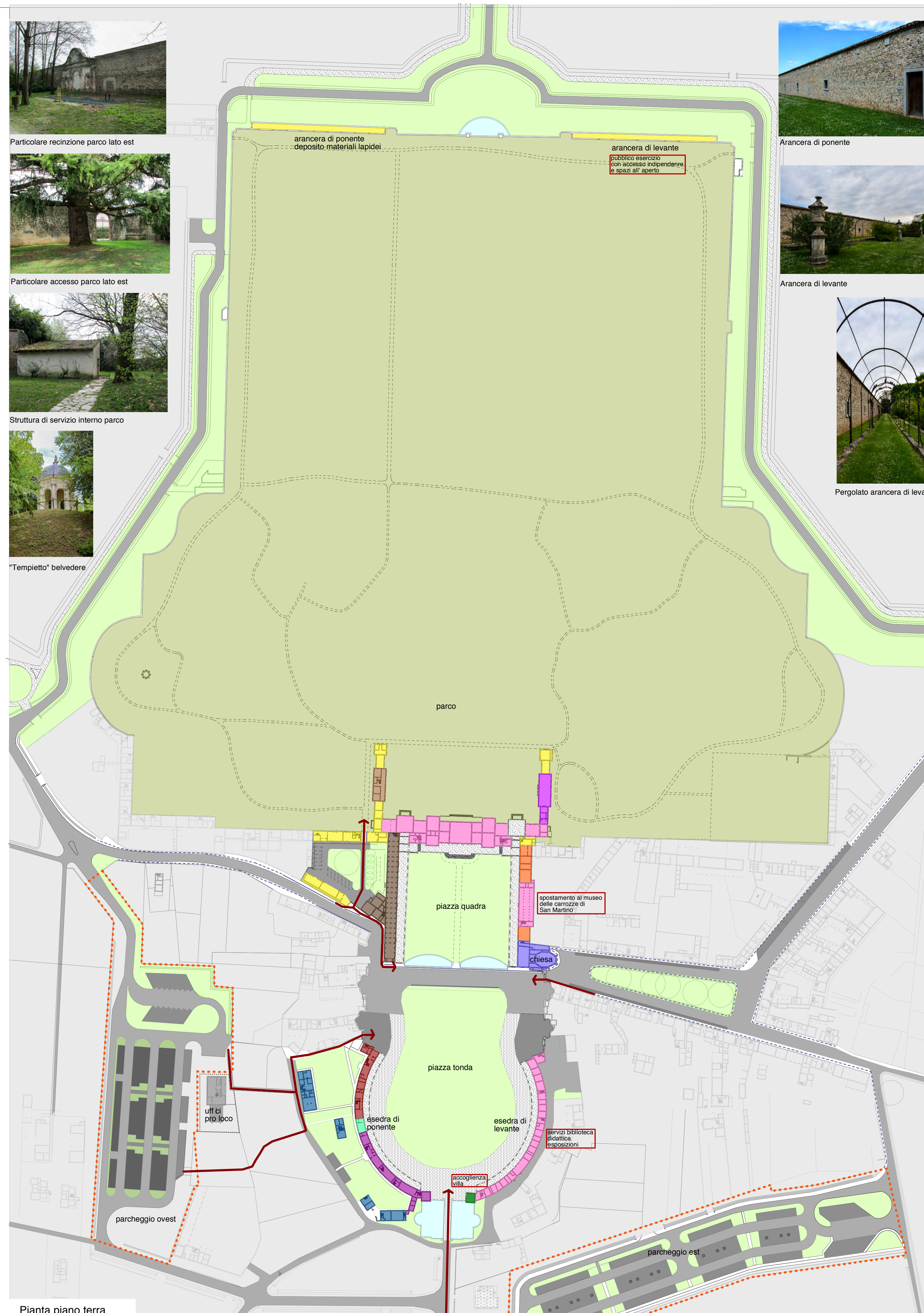
Pianta piano terra