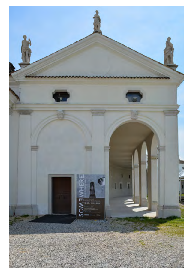
Piano terra esedra di levante - prospetto