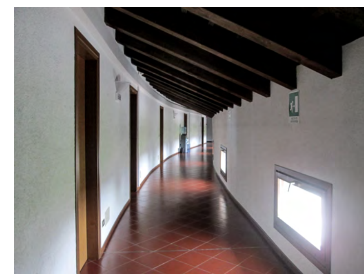
Piano secondo esedra di ponente - interno