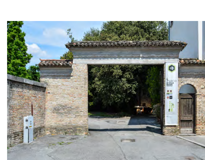
Accesso al parco da via Dei Dogi